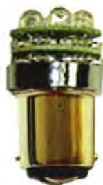
18-diodes LED-lys til ca. 80-90 kr.

hevet Led-lysenes fortrinn i for eks. topplater. LED-lysene avgir heller ikke strålevarme, du brenner deg ikke på dem og de er heller ikke så brannfarlige som vanlige pærer. Siden LED avgir lite varme kan man montere flere dioder ved siden av hverandre for å øke lysstyrken.