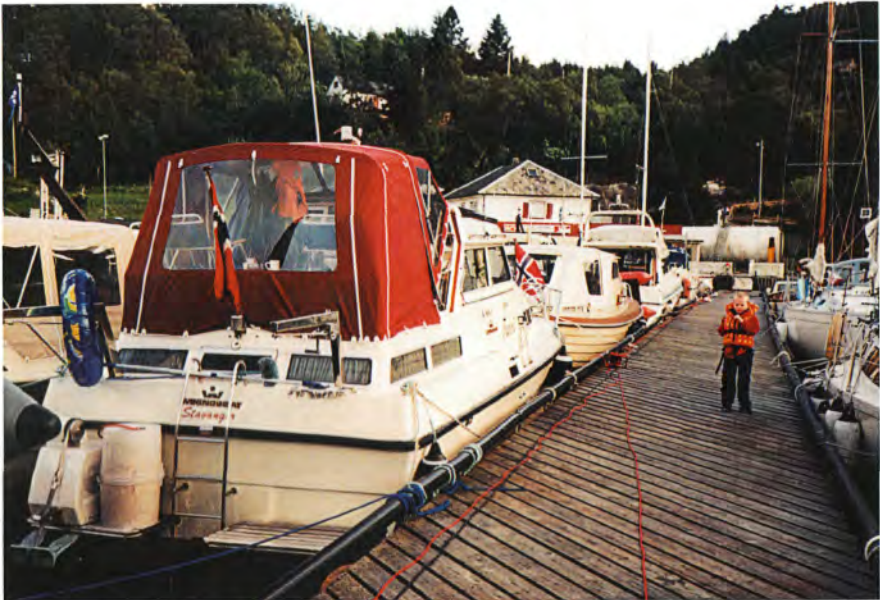
Fra flytebryggen i Sjøstovo midt i båtsesongen.