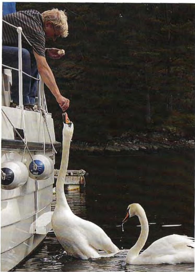
Svanemating i Bjellebøvågen.