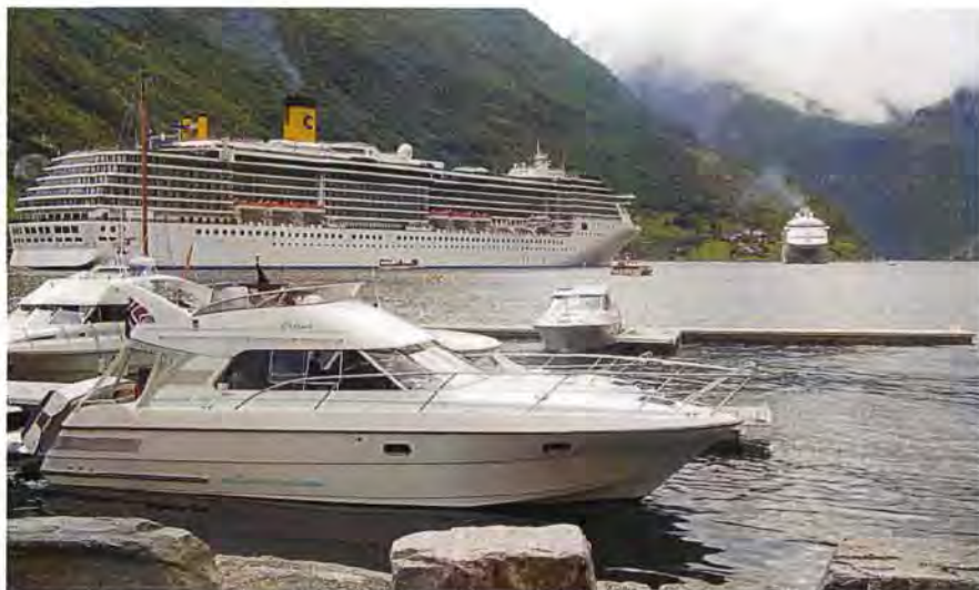
”Celina” i Geirangerfjorden.